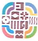
Tabla de aplicabilidad integral