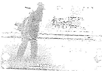
infografia 2.jpeg 48K