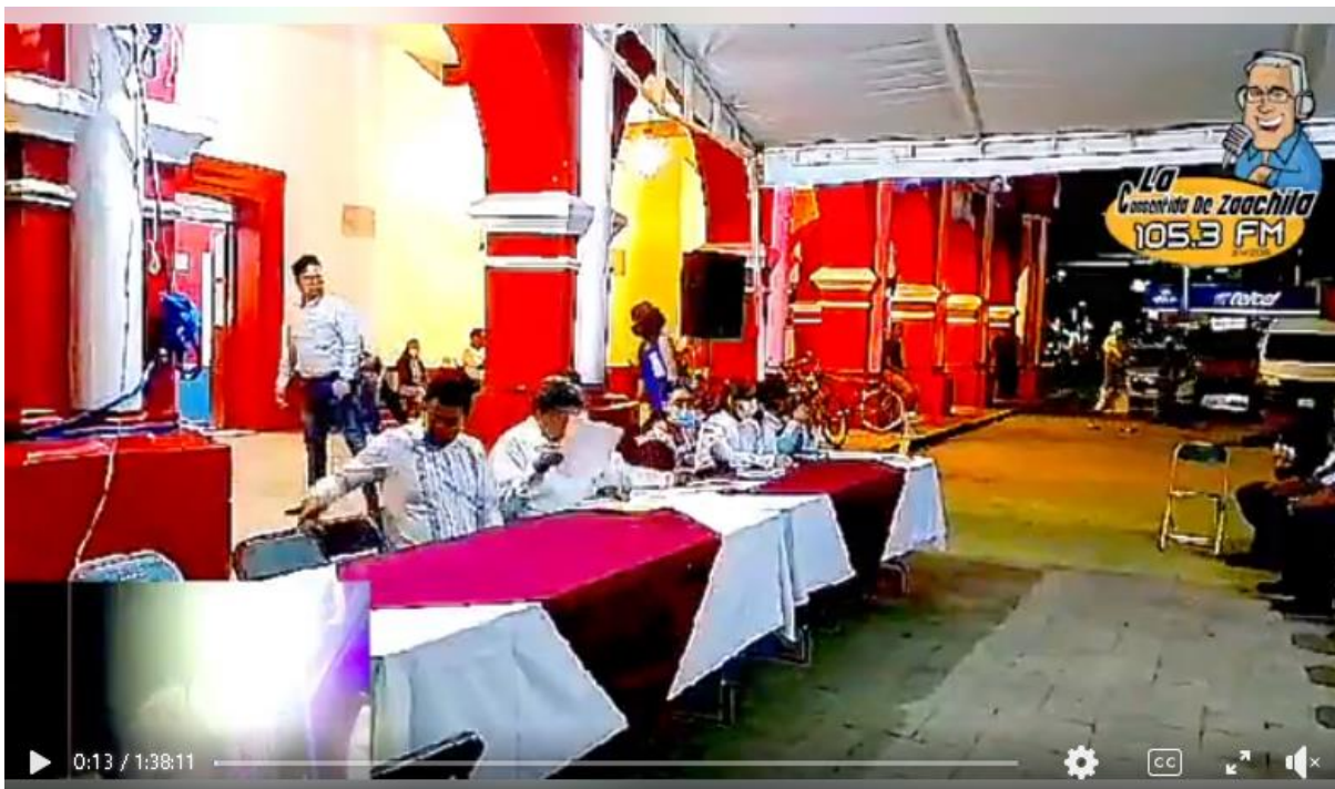
Reunión para tratar el tema de la Basura en Zaachila. Convoca la autori...

En el caso que nos ocupa, el ahora recurrente solicitó al Sujeto Obligado, información relativa a un proyecto que presentó el presidente municipal a la comunidad en día 17 de abril del 2023, remitiendo un enlace electrónico que dirige a un video clip en la plataforma Facebook bajo el título “reunión para tratar el tema de la basura en Zaachila”, tal como se muestra a continuación: