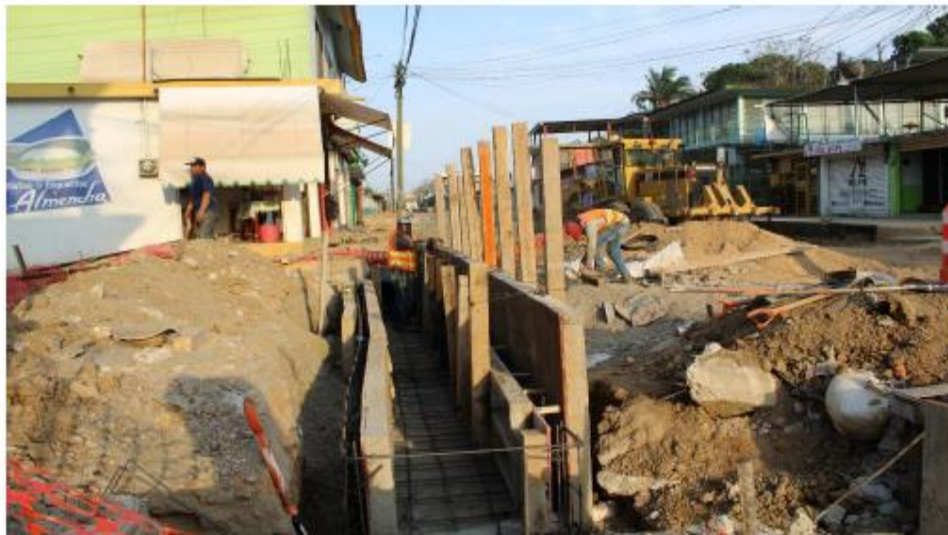
AVENIDA 5 DE MAYO # 281 COL CENTRO C.P. 68300