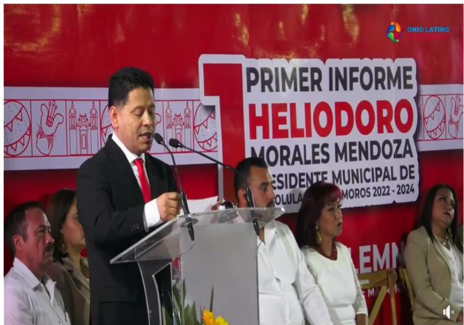
1er. Informe de Gobierno

Vídeo Inicio Directo Reels Programas Explorar