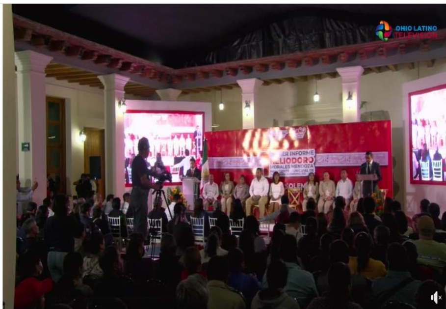
1er. Informe de Gobierno

Vídeo Inicio Directo Reels Programas Explorar