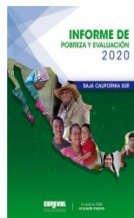
Baja California Sur